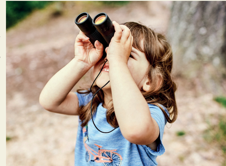
Text: Annika Horstck, VDN